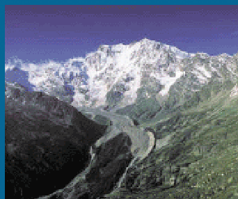
MONTE ROSA 4.634 mslm

Le iscrizioni si ricevono presso la sede del Club Alpino Italiano-sez. di Desio dalle ore 21 alle ore 23