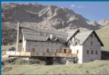
Rifugio Ca' Runcasch (2170 m)

In Valmalenco, circondati dalla piramide del Pizzo Scalino e dal torrione della cima Sasso Moro