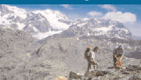
salendo al Pizzo Scalino