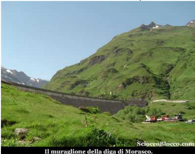
Il muraglione della diga di Morasco.

Dalla diga del Lago Morasco si prosegue sulla strada sterrata costeggiando il lago, fino alla partenza della funivia del Sabbione, ove termina, a quota 1850 m.